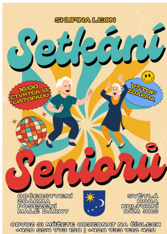
Obrázek 3 Setkání seniorů

Také aktivní účast na akci Setkání seniorů určenou pro seniory obce Světlá Hora a místních částí Dětrichovice, Světlá, Suchá Rudná, Podlesí a Stará Voda, která se konala 13.11.2025, nám umožnilo lépe se propojit s občany a zvýšit povědomí o našem poslání a službách.