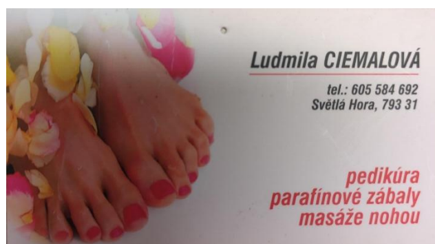
Obrázek 5 Spolupracující subjekty

Aktivně spolupracujeme také s rodinnými příslušníky a blízkými osobami našich klientů, kteří se podílejí na péči o uživatele, což podporuje integrovaný přístup k poskytování sociálních služeb.