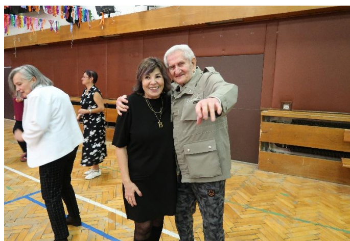
Obrázek 4 Setkání seniorů

Známkou dobré kvality je pro nás také to, že v roce 2025 nebyla evidována stížnost, podnět či připomínka na kvalitu a způsob poskytování Pečovatelské služby Světlá Hora, nebo na chování či jednání zaměstnanců pečovatelské služby.