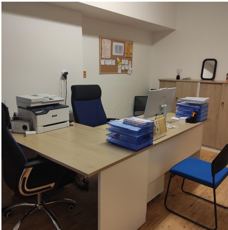
Obrázek 2 Kancelář pečovatelské služby

Cílem organizace pro rok 2025 bylo zajistit a vybavit kancelář pečovatelské služby, zázemí pro pracovníky v sociálních službách a sociální zařízení pro pracovníky pečovatelské služby v Domě s pečovatelskou službou.