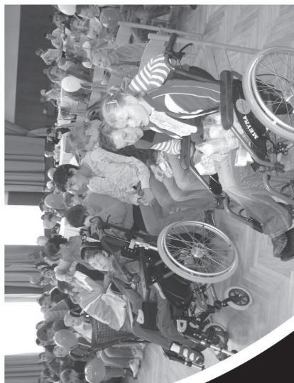
Tyto děti jsou vděčnými diváky